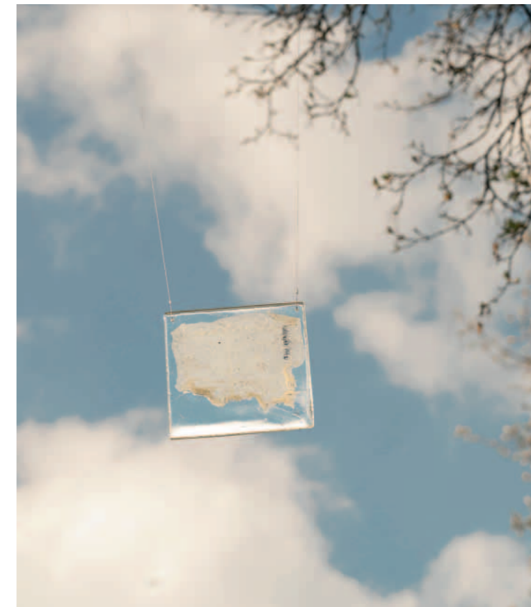
Birgit Rumpf Luftfragmente | 2014 – 2026